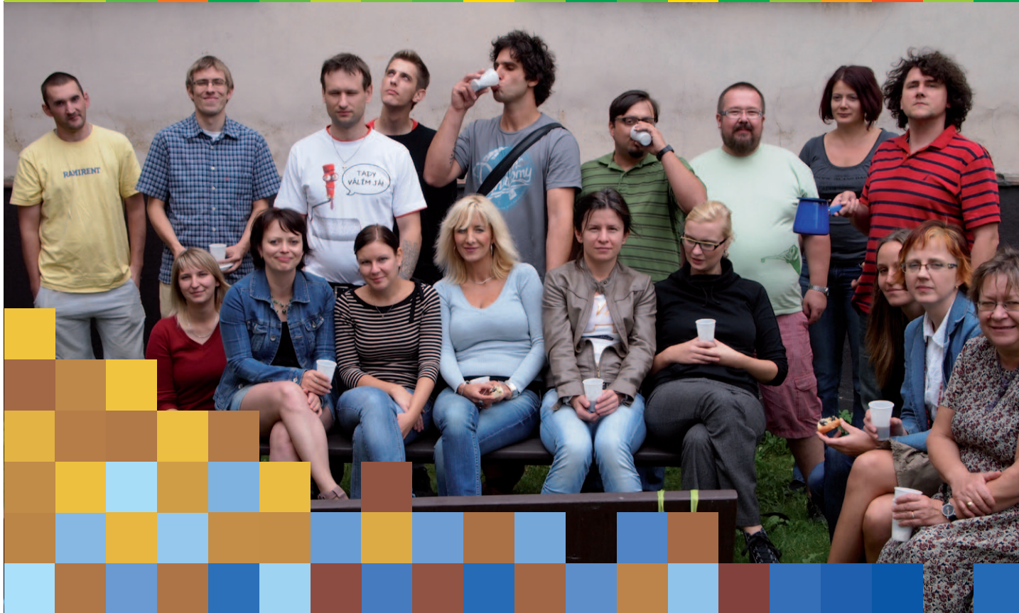
Tým pracovníků SKP - Plzeň a POINT 14